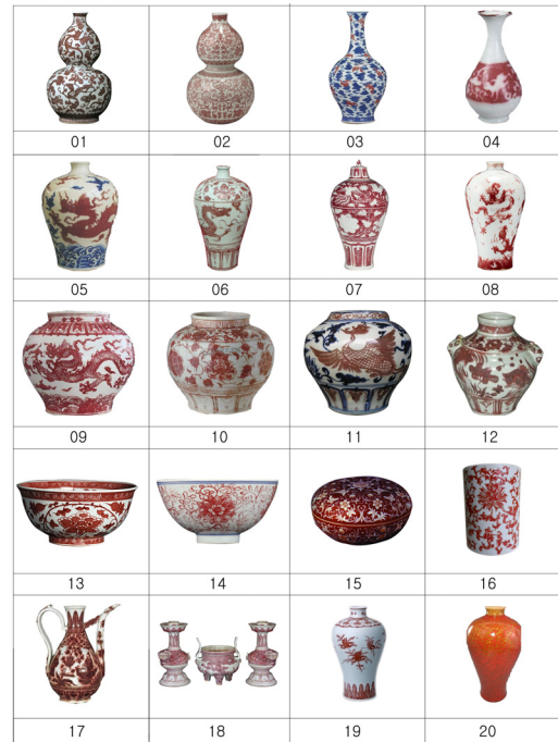
[그림2] 유리홍 자기

둥, 창문에 많이 사용했다. 빨강은 부귀와 권력을 상징이었고 고대 사람들의 사회적 지위를 의미한다. 유리홍(釉里紅) 자기는 원나라 때 처음으로 만들어 졌다. 이름과 같이 주요 색채는 빨강이다.