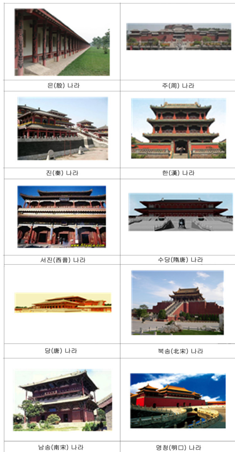
[그림1] 각 시대의 궁전

한 시대의 궁전은 그 시대의 대표적인 건축물이라고 할 수 있고 권력의 상징이라고도 할 수 있다. 궁전에 쓰는 색채나 디자인은 규정되어 있고 특별한 의미가 가지고 있었을 것이다.